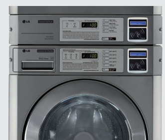
version avec double lecteur de cartes privées RFID