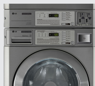
version avec double monnayeur pour jeton et/ou pièces