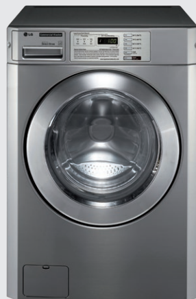
FH069FD2FS Tiroir à lessive en façade. Superposable avec séchoir GIANT