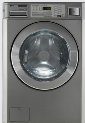
FH069DFDS à superposer avec séchoir équipé d'un monnayeur double. Emplacement pour tiroir à pièces.